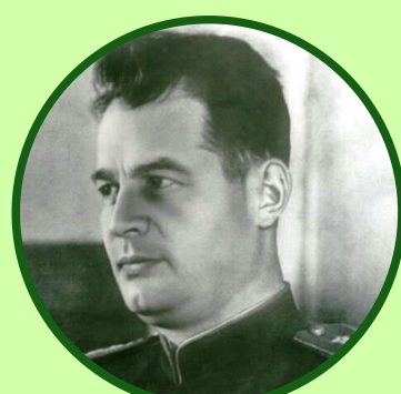
И.Д. Черняховский (3-й Белорусский)