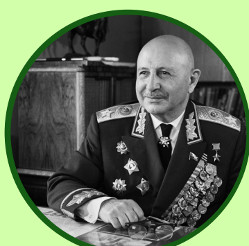
И.Х. Баграмян (1-й Прибалтийский)